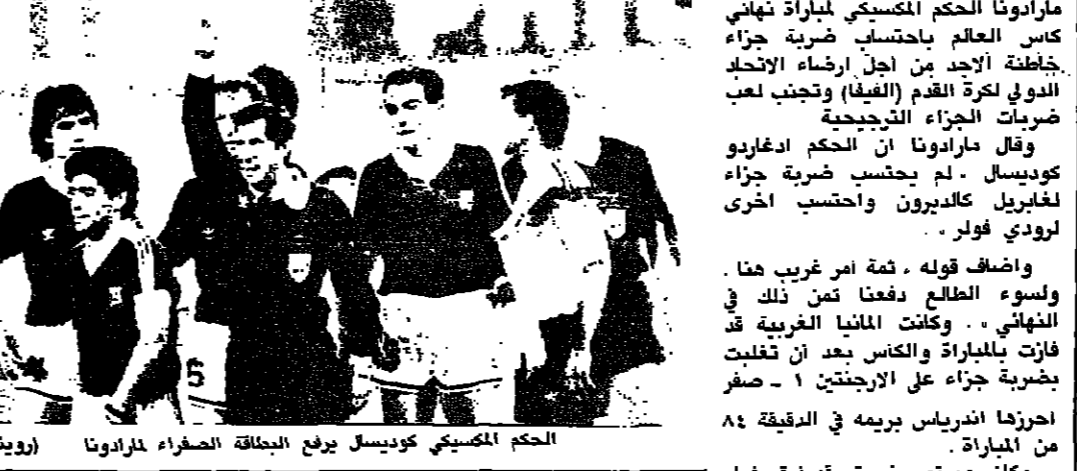
الحكم المكسيكي كوبيسيل يرفع البطاقة الصفراء لمارادونا